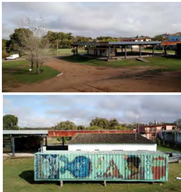
Imagem 2. “Centro de Comércio Informal” e contêiner ao lado da Ponte Internacional Barão de Mauá, em Jaguarão

Centro de Comércio Informal ao lado de um contêiner com várias pinturas que não parecia estar lá por acaso. Isso também seria a fronteira cultural, era uma pergunta pertinente.