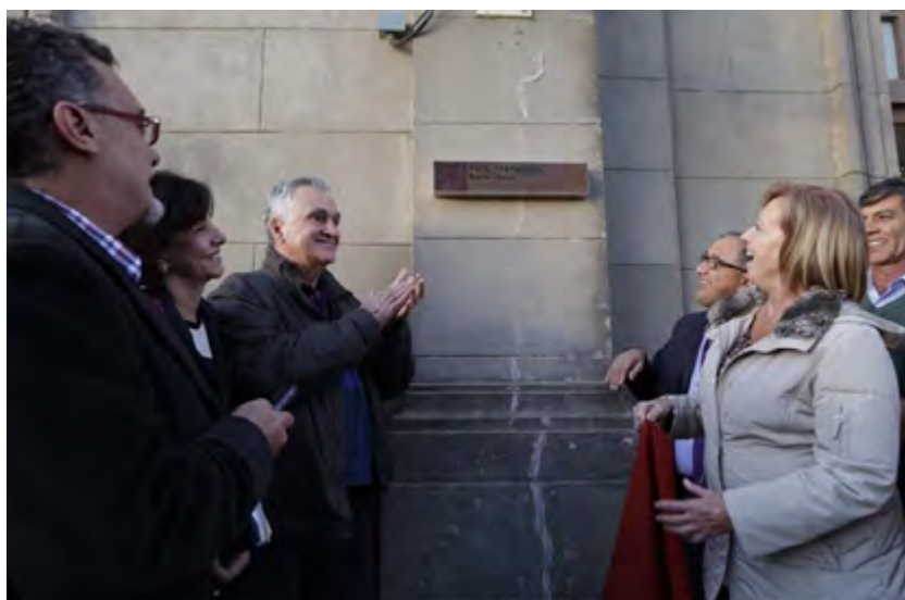
Imagem 1. Ministro da Cultura do Brasil, Juca Ferreira, e Ministra de Educação e Cultura do Uruguai, Maria Julia Muñoz. 30 maio 2015

Brasil e Uruguai por meio dos municípios de Jaguarão e Rio Branco. Por isso, foi possível depois da reunião que, os ministros e boa parte dos que estávamos lá presentes, nos deslocássemos até ela. Atravessamos a ponte até a aduana uruguaia, onde as autoridades máximas dos dois países presentes naquele momento descerraram uma faixa que cobria uma placa indicativa, simbolizando o reconhecimento oficial de um bem cultural do Mercosul.