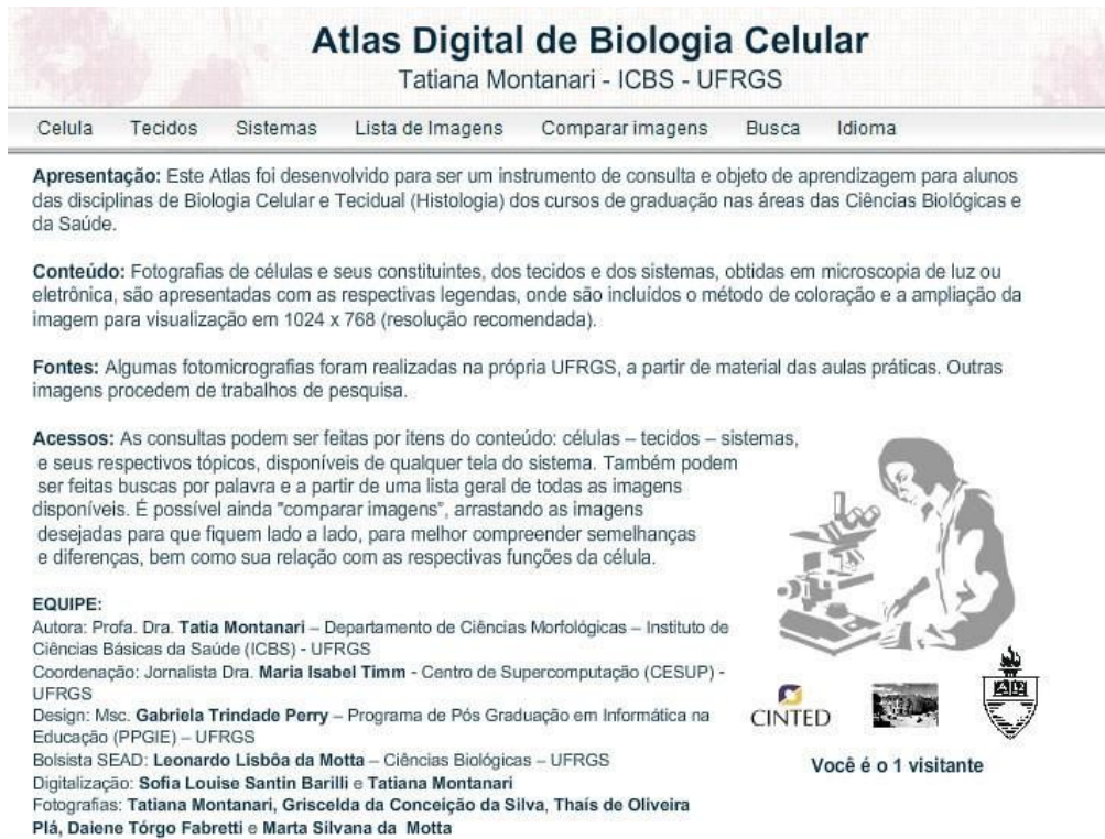
Figura 1 – Tela de apresentação.