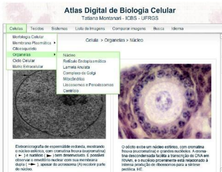
Figura 2 – Tela de navegação: página do conteúdo de células – organelas – Núcleo. A informação sobre a localização do visitante (em qual seção ele se encontra) está sempre disponível.