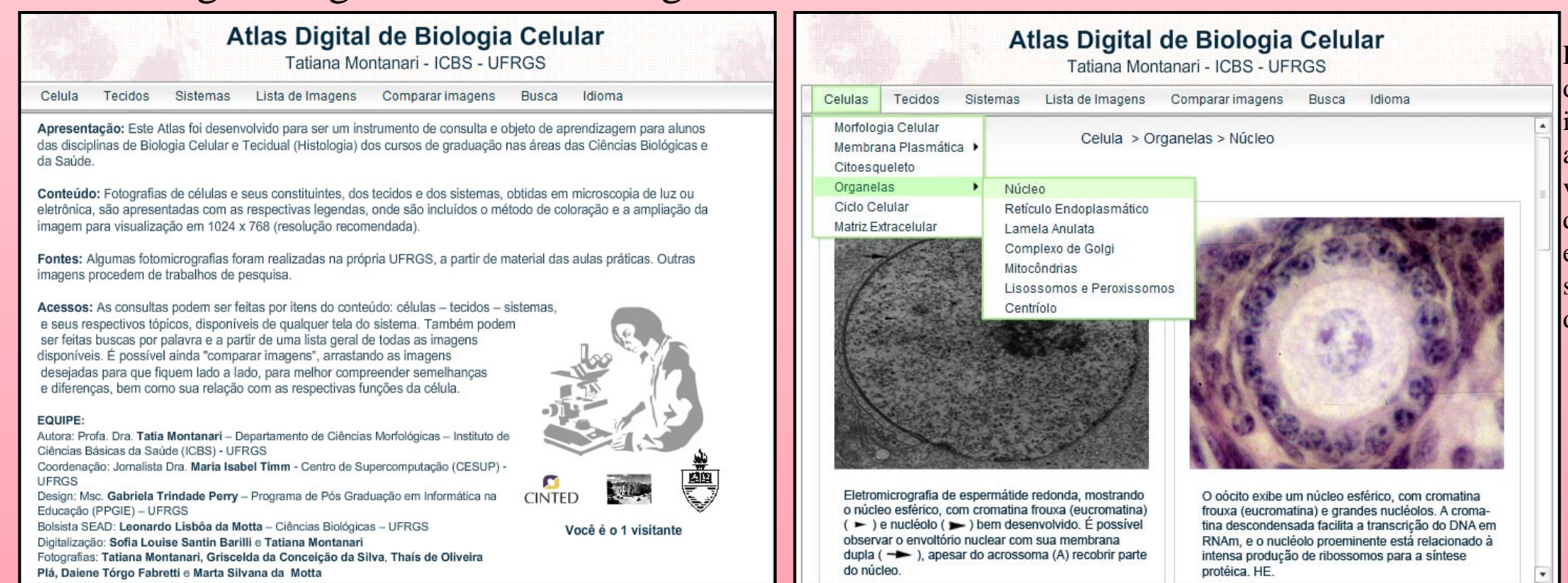
Figura 2 – Tela de navegação. A informação sobre a localização do visitante (em qual seção ele se encontra) está sempre disponível.

As imagens seguintes ilustram algumas telas do Atlas.