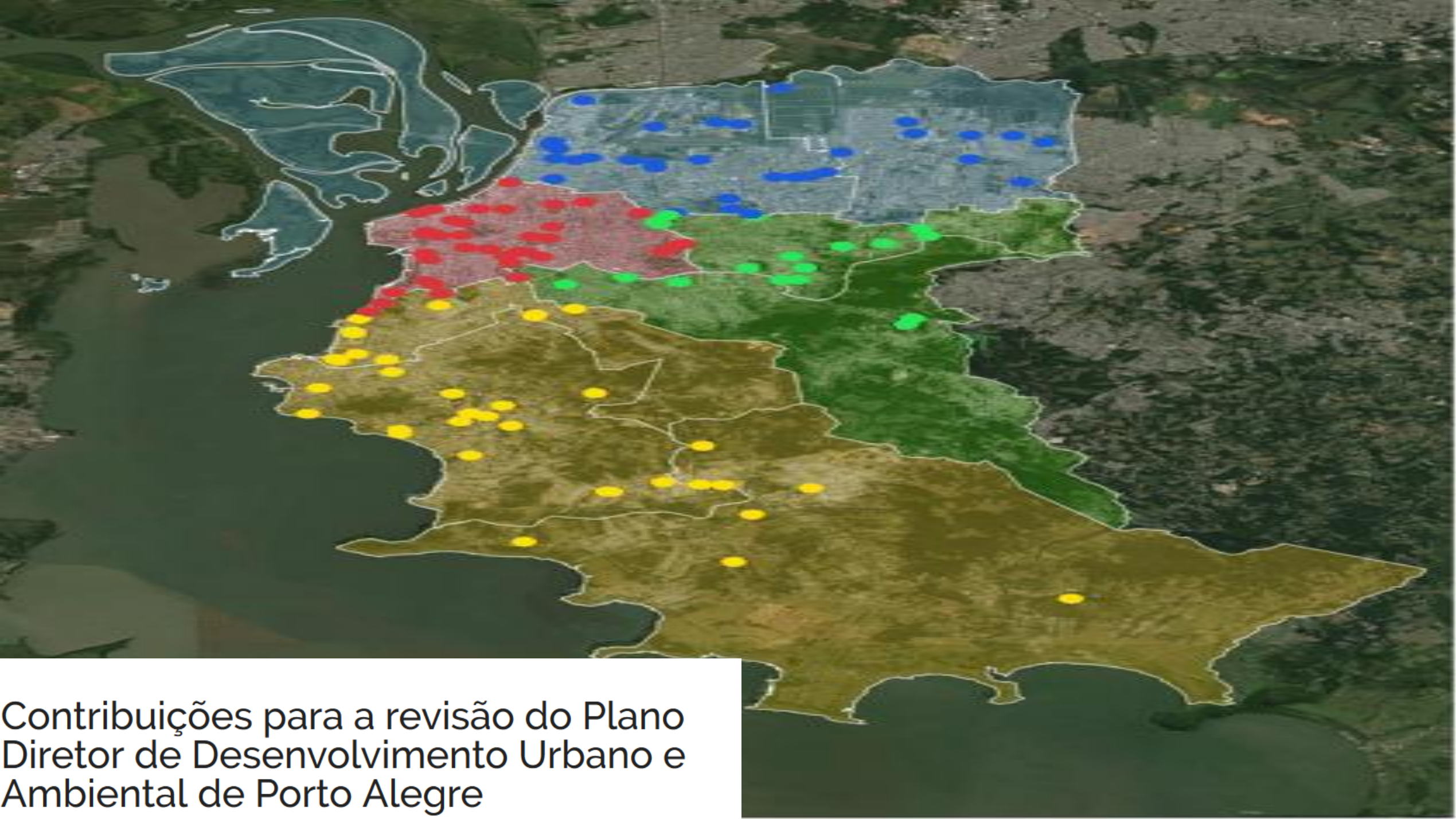
Contribuições para a revisão do Plano Diretor de Desenvolvimento Urbano e Ambiental de Porto Alegre